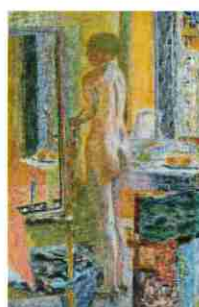
Pierre Bonnard, La Toilette dit aussi Nu devant la glace , 1931 Galleria Internazionale d'Arte, Fondazione Musei Civici di Venezia, Italie

Été 2026 - Bonnard- Les Toilettes de Marthe en partenariat avec le Musée International de la parfumerie de Grasse pour un parcours olfactif de l'exposition