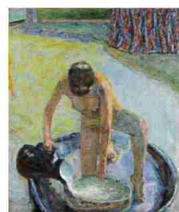
Pierre Bonnard, Nu accroupi au tub , 1918 Musée d'Orsay, Paris

Été 2026 exposition dossier autour de L'Atelier au mimosa , prêt exceptionnel du Centre Pompidou