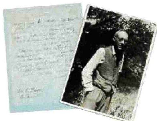
LAS P Bonnard, villa le Bosquet, Le Cannet à M. Dumouin 1942