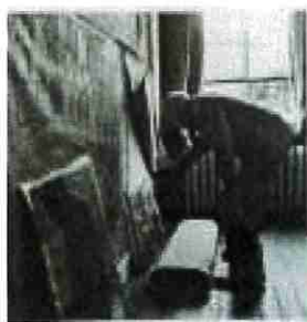
Pierre Bonnard dans son atelier, 1946

Enfin, un dossier pour chaque peinture de son catalogue raisonné est créé afin d'affiner la connaissance de chacune d'elles.